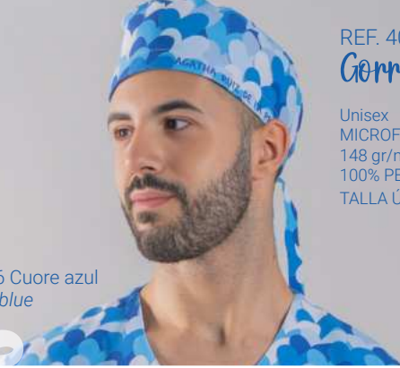
c/5146 Cuore azul Cuore blue

Unisex MICROFIBRA/MICROFIBRE 148 gr/m 2 100% PES TALLA ÚNICA/ONE SIZE