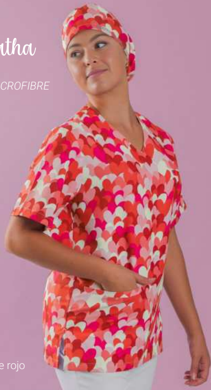
c/5147 Cuore rojo Cuore red

Unisex MICROFIBRA/MICROFIBRE 148 gr/m 2 100% PES XS-XXL