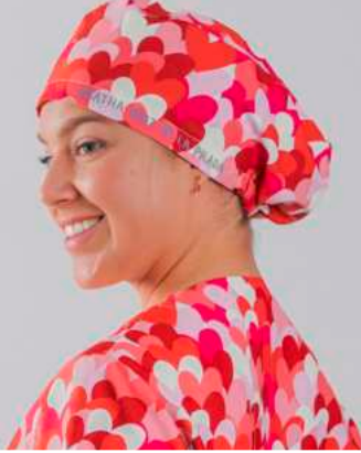
c/5147 Cuore rojo Cuore red

Unisex MICROFIBRA/MICROFIBRE 148 gr/m 2 100% PES TALLA ÚNICA/ONE SIZE