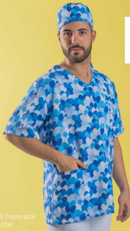
c/5146 Cuore azul Cuore blue