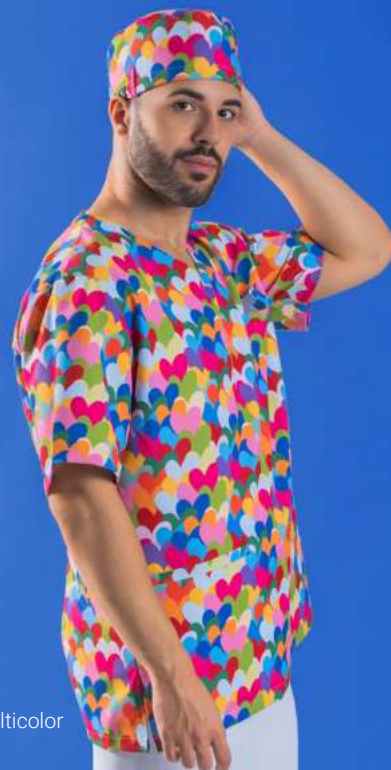
c/5149 Cuore multicolor