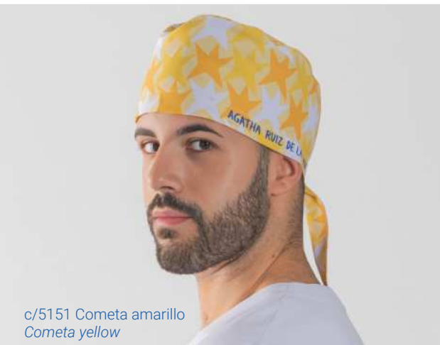
c/5151 Cometa amarillo Cometa yellow