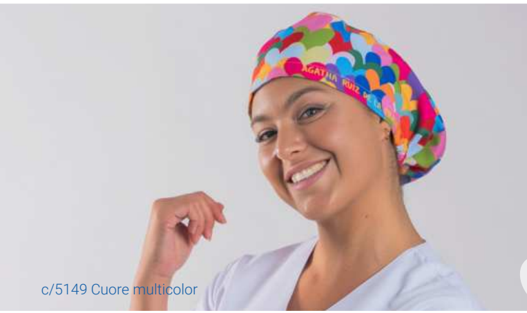
c/5149 Cuore multicolor