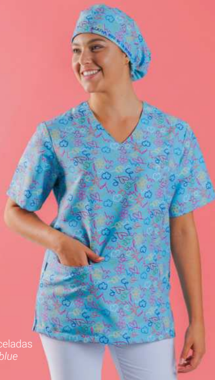
c/5153 Pinceladas Pinceladas blue