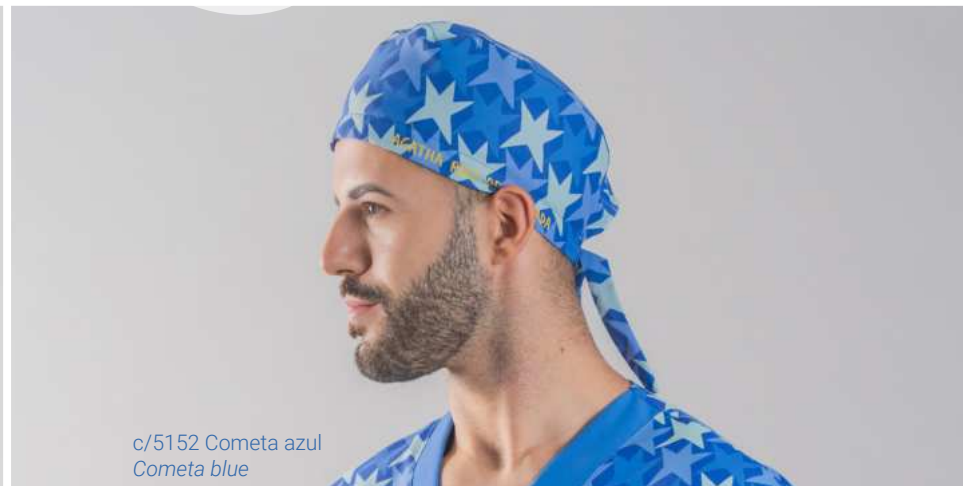
c/5152 Cometa azul Cometa blue

Con tejido absorbente para sudoración en el frontal interior.